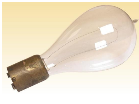
De kooldraadlamp (aan het tuutje zat een buisje waardoor de lucht uit de ballon werd gezogen; daarna werd het buisje dichtgesmolten en afgeknipt).

Het verhaal begint met een batterij. Die werd in 1800 door Alessandro Volta uitgevonden. Hij was heel eenvoudig te maken en bestond uit schijfjes koper en schijfjes zink. Tussen de schijfjes zaten kartonnetjes die in een zuur waren gedoopt. Eigenlijk was het een stapel kleine batterijtjes.