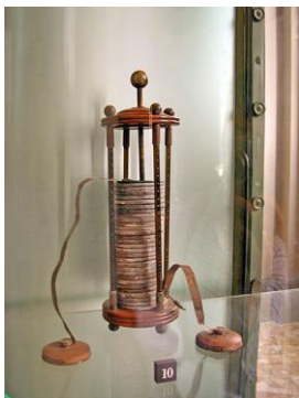
De eerste batterij van Alessandro Volta, uit 1800

Bij een lichtmachine horen ook lampen, want die zorgen uiteindelijk voor verlichting.